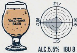
ヴァイツェン HEFE WEIZEN

"黒ビールのイメージを覆す軽快さ" 苦みは極力抑えて、アルコールも低め。 IPAらしい柑橘のようなホップの香りと モルトのロースト感がほんのり残るテイストの黒ビール。