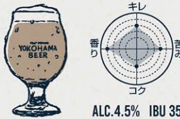
ハマクロ SESSION BLACK IPA

"香ばしい琥珀色のビール" ドイツデュッセルドルフ伝統の琥珀色のビール。 焼きたてのビズケットのようなローストされた麦の香ばしさと 酵母によるみずみずしくほのかに甘い香りが特長。