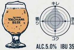
パールエール AMERICAN PALE ALE

"フルーティーな白ビール" 南ドイツのスタイル。酵母由来のバナナのような香り。 苦みが少なく、ビールを飲み慣れない 方からの人気も高い。