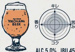
横浜ラガー INDIA PALE LAGER

"横浜瀬谷の小麦で造ったビール" 横浜瀬谷区の岩崎農園さんが 丹精込めて育てた小麦で造ったエールタイプのビール。 小麦のやさしい飲み口とスッキリとした苦みが特長。