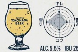
瀬谷の小麦 BELGIAN WHEAT ALE

"スッキリ爽やかな香りと苦み" 鼻に掛けるシトラス系の清々しいホップの香りと ほどよい苦みのバランスが絶妙で飲み飽きしない。 軽やかな口当たりでスイスイ飲めるビール。