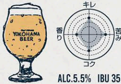
ピルスナー BOHEMIAN PILSNER

M 1000 / L 1300 SIZE (350ml) / SIZE (500ml) BEER FRIGHT テイステイングセット 3 1100 / 5 1500 TYPES (150ml x 3p) / TYPES (150ml x 5p)