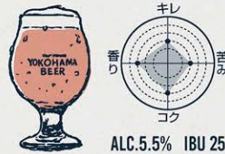
アルト DÜSSELDORF ALT

"心地よいホップの余韻が続く" 美しい黄金色のチェコスタイル・プレミアムビール。 コクのあるモルトのフレーバー、 チェコ産アロマホップの上品な香りと苦味が特長。